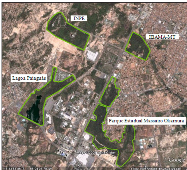
Figura 2 – Áreas Verdes Remanescentes na Região do CPA, Cuiabá-MT

Parque Estadual Massairo Okamura : Essa área foi criada em 1989 como Reserva Ecológica do CPA, compreendendo 180 hectares. Após mais de uma década de invasões, por não possuir demarcação oficial, área foi transformada em Parque Estadual Massairo Okamura (Decreto n. 3.345 de 08/11/ 2001), já com 53,75 hectares, tendo sua área original reduzida em 70,14% em relação a sua dimensão original. A cobertura vegetal do Parque é caracterizada por espécies de cerrado, cerradão e uma mata de galeria bem definida.